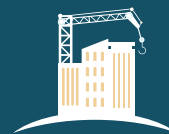
Entreprises de Construction